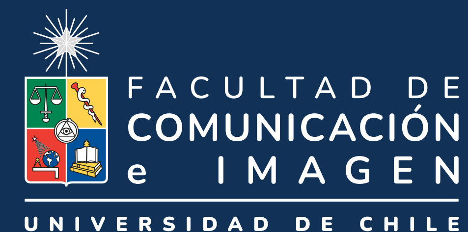
Blanco con escudo de colores